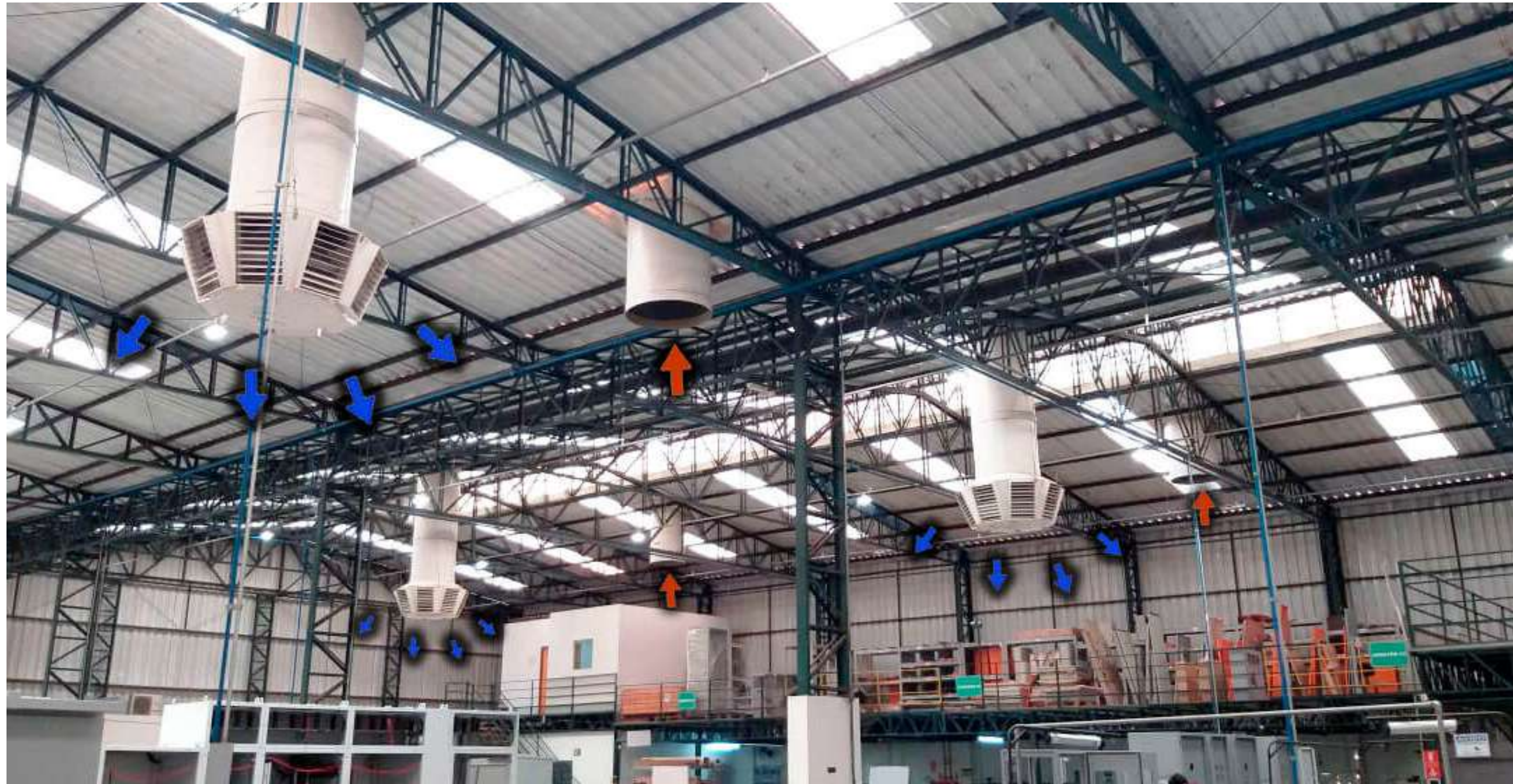
Sistema de Ventilação Diluidora