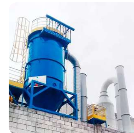
Controle de Poluição