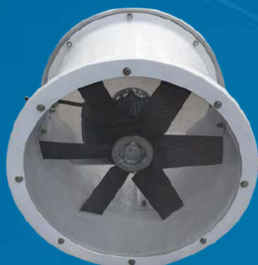
Exaustor Axial à Prova de Explosão