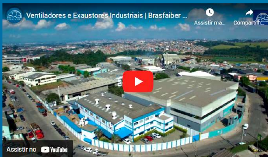
Sobre a Brasfaiber