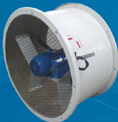
Plástico Reforçado com Fibra de Vidro (PRFV)