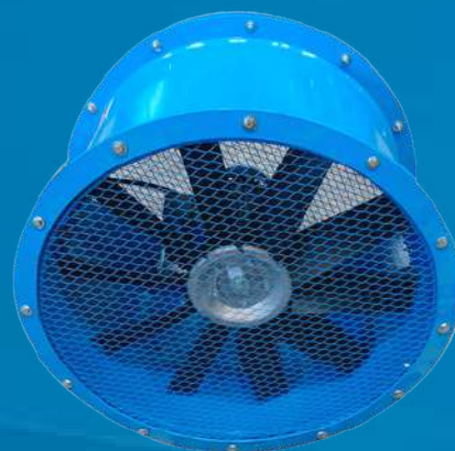
Chapa de aço (CH)

O Exaustor à Prova de Explosão segue parâmetros industriais que asseguram sua alta qualidade, resistência e durabilidade em ambientes classificados. Com essas características, o equipamento oferece proteção frente a ação de substâncias inflamáveis, além de garantir alta performance durante a operação industrial.