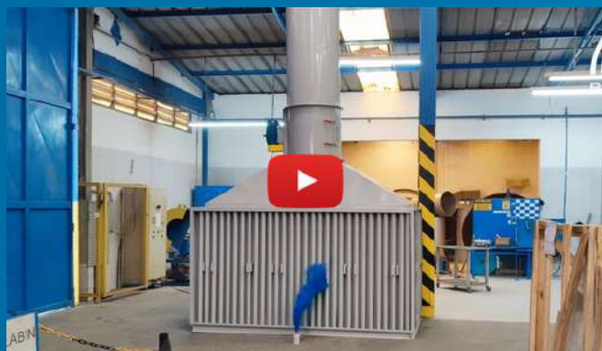
Assista uma Demonstração - Cabine de Pintura

Por meio da cabine de pintura industrial é possível que o profissional que aplicará a pintura esteja em segurança e livre de certas toxinas que a tinta pode espalhar pelo ar. Uma cabine de pintura se livra de todas essas toxinas, limpando o ambiente e permitindo que a pintura seja feita com excelência.