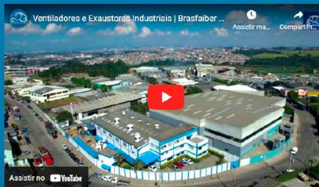
Sobre a Brasfaiber

Este equipamento adequa a área de Pintura, para realizar o controle de poluentes gasosos, atendendo as normas de qualidade e legislação ambiental, conforme art. 40 – decreto 8468-76.