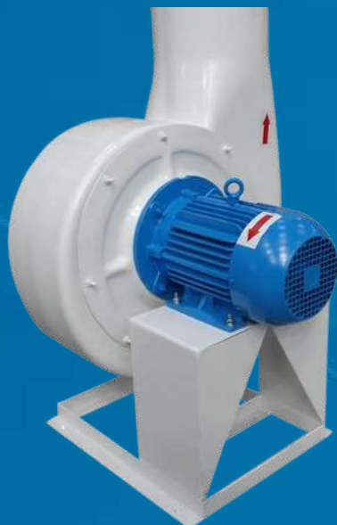
Exaustor centrífugo em Fibra de Linha