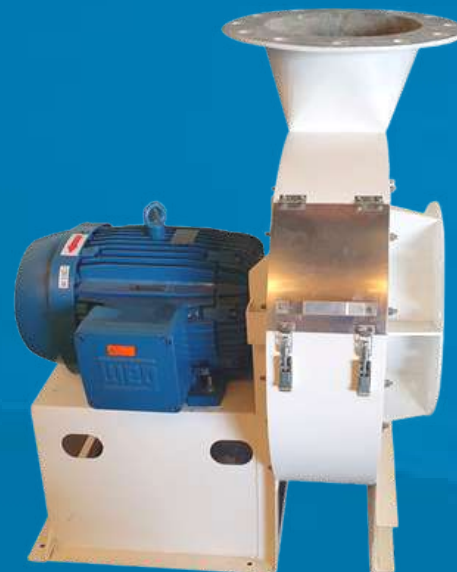
Exaustor Centrífugo Sob medida