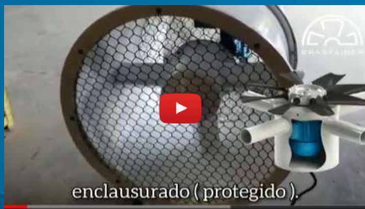
Assista uma Demonstração - Exaustor enclausuraado