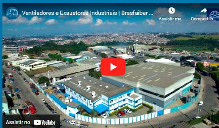
Sobre a Brasfaiber

Av. Industrial, 1561- Itaquaquetuba SP - CEP: 08586150 Tel: (11) 4648-8241 vendas@brasfaiber.com.br https://www.brasfaiber.com.br