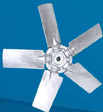
Opcional: Hélice em Alumínio