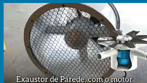
Exaustor de Parede, com o motor