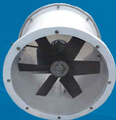
Plástico Reforçado com Fibra de Vidro (PRFV)