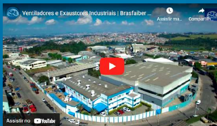
Clique para ver nosso vídeo institucional

Av. Industrial, 1561- Itaquaquetuba SP - CEP: 08586150 Tel: (11) 4648-8241 vendas@brasfaiber.com.br https://www.brasfaiber.com.br