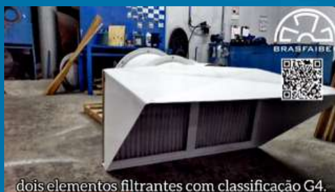
dois elementos filtrantes com classificação G4.