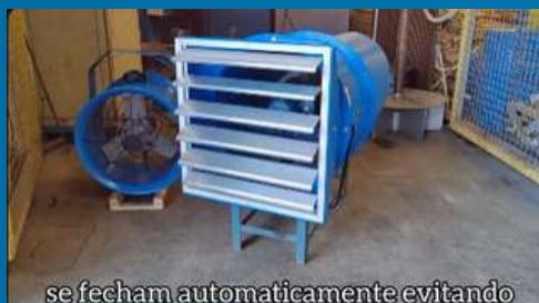
se fecham automaticamente evitando