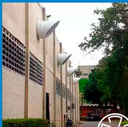
Instalado em Alvenaria