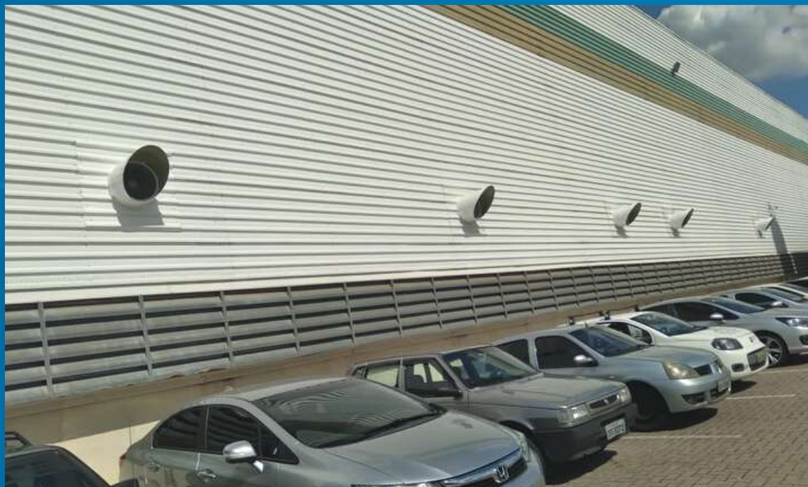
Opcional: Acessório Telha Lateral Instalado