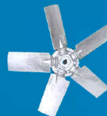
Optional: Hélice em Alumínio

Como padrão de qualidade Brasfaiber, o Ventilador de Parede à Prova de Explosão em PRFV é resistente à corrosão imposta por intempéries (chuvas, umidade, maresia etc.). Com isso, o dispositivo tem maior tempo de vida útil, menos manutenção e alta performance nos processos da operação.