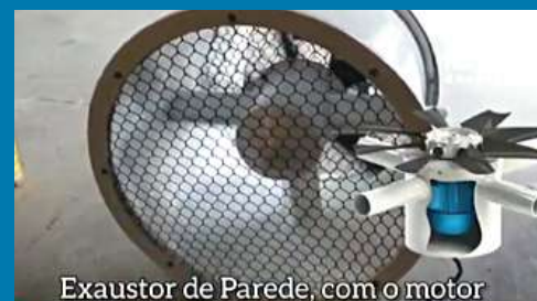
Exaustor de Parede, com o motor