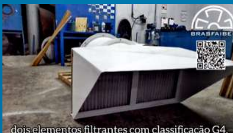
dois elementos filtrantes com classificação G4.