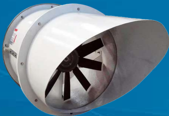
Plástico Reforçado com Fibra de Vidro (PRFV)